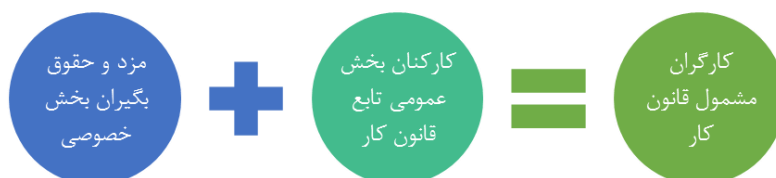
شکل ۲- محاسبه کارگران مشمول قانون کار