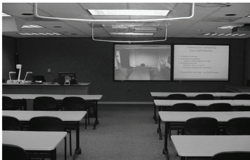
شکل ۲- یک کلاس ویدئویی JPSM در دانشگاه مرلند. سایت از راه دور در سمت چپ قابل مشاهده است؛ و در سمت راست یادداشتهای استاد.

همکار اصلی علمی ما مؤسسه‌ی پژوهش اجتماعی در دانشگاه میشیگان است که دوره‌ی با مدرک روش‌شناسی آمارگیری خود را در ۲۰۰۱ تأسیس کرده است. JPSM و دوره‌ی روش‌شناسی آمارگیری میشیگان (MPSM) ۵ بسیاری از درس‌های کارشناسی ارشد و دکترا را با استفاده از ارتباط‌های ویدئویی به‌صورت مشترک ارائه می‌دهند. دانشجویان دو مکان می‌توانند یکدیگر، جزو‌های درسی، استاد را ببینند و نیز می‌توانند در بحث‌های کلاسی شرکت کنند. شکل ۲ یکی از این کلاس‌های ویدئویی در مرلند را نشان می‌دهد. همچنین استادان برای تدریس به‌صورت منظم بین دو دانشگاه سفر می‌کنند تا دانشجویان هر دو مکان بتوانند با هر استاد به‌صورت شخصی مشورت کنند. دفتر سرشماری ایالت‌های متحده و دفتر آمارهای کار نیز به‌تازگی کلاس‌های مجهز به ویدئو را راه‌اندازی کرده‌اند. برای برخی از درس‌ها استادان به‌نوبت در JPSM، میشیگان، دفتر سرشماری و دفتر آمارهای کار سخنرانی می‌کنند. JPSM همچنین بسیاری از سخنرانی‌های کلاسی را ضبط می‌کند تا هر دانشجویی که کلاس را از دست داد بتواند بعداً آن را با استفاده از وب ببیند.